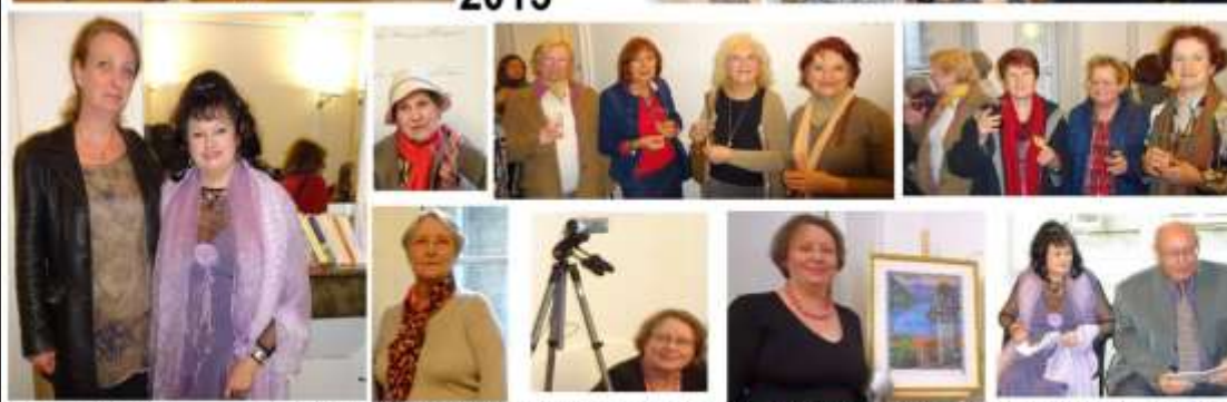
Carine D'Inca Photos Arlette Balme, Jacqueline Cialdella, Peinture Le lac de Côme de LISette Blanc