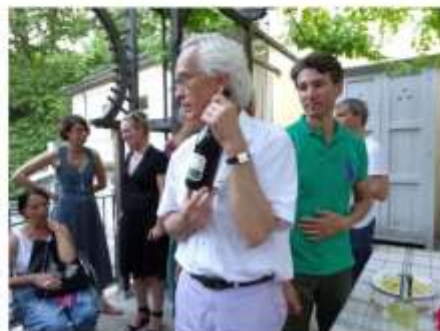
Photomontage LISette Blanc