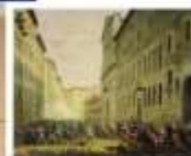
Alexandre DEBELLE JOURNÉE DES TUILES