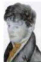
Henri BEYLE STENDHAL