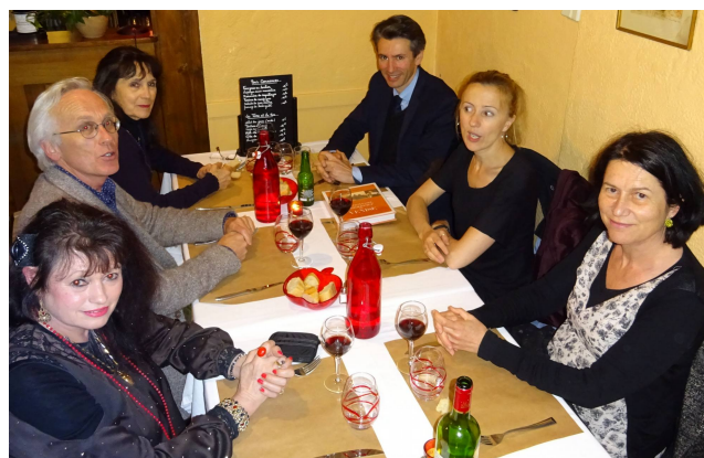
Photomontage LISette Blanc

La soirée se termine autour d'un repas amical.