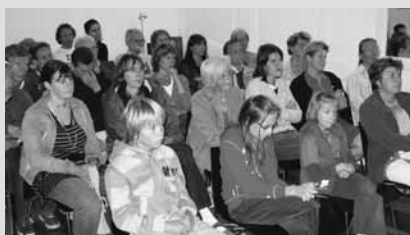
Journées du Patrimoine à l'Appartement Natal : encore plus sages qu'en classe...