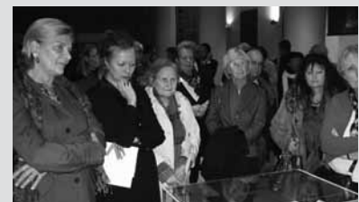
Présentation des récentes acquisitions de manuscrits stendhaliens, dont un fragment de De l'Amour , avec l'aide financière des Associations Stendhal de Grenoble et Paris.